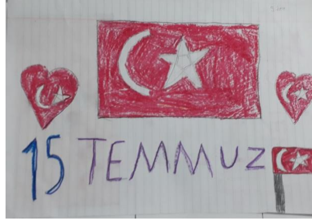
Aze Naz Mutluer(6/D)